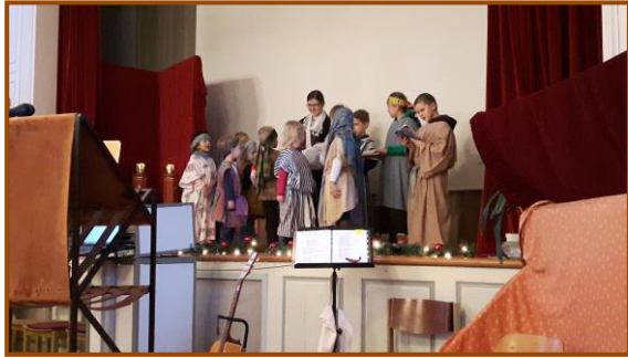
Kinder vom Kindergottesdienst bei der Senioren-Adventsfeier